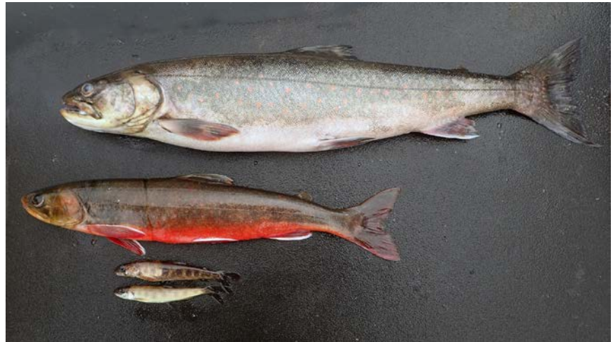
Grårøye, normalrøye og dvergørøye fra Limingen.