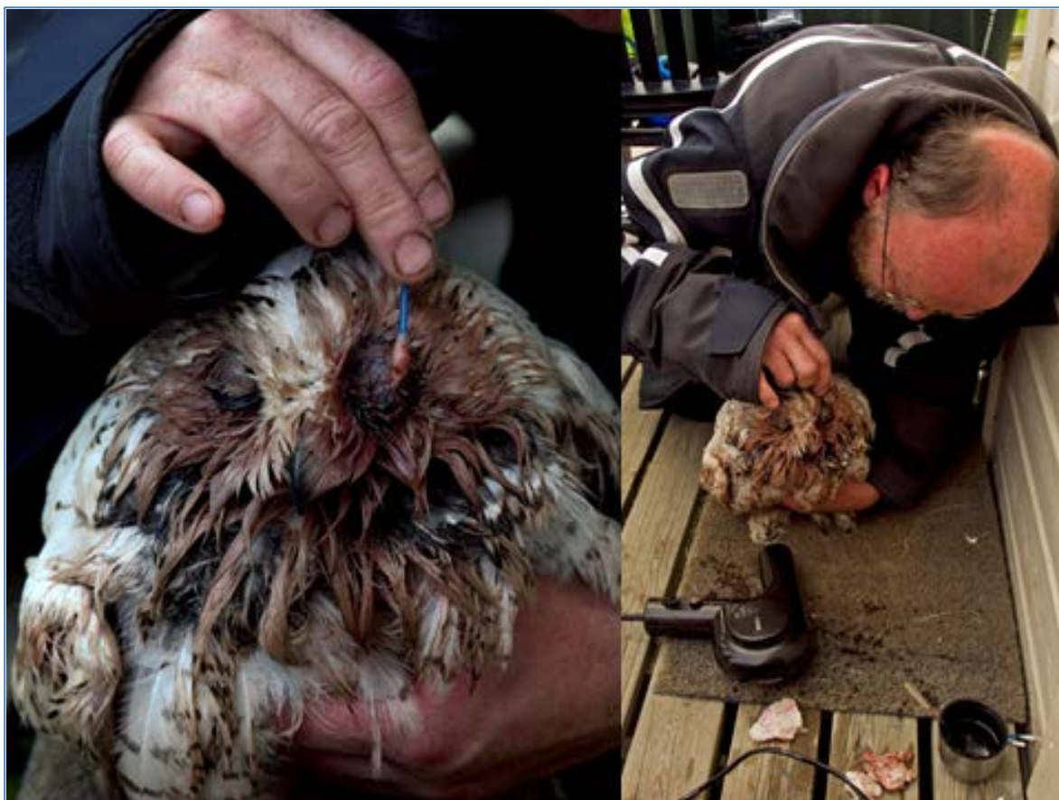
Figur 3. Snøuglehunnen Hedwig under behandling etter insektsangrepet.

og lav temperatur ( Figur 2 ). Hunnen hadde sannsynligvis ikke beskyttet og varmet ungene, eller gitt opp dette under regnværet. Et annet par mislyktes med hekkingen fordi hunnen hadde blitt kraftig angrepet av knott, og var ute av stand til å ta vare på seg selv og enda mindre i stand til å ta vare på de sju ungene sine (og tre egg), som ble funnet døde eller døende. Vi tok hunnen inn til rekonvalesens, og kunne slippe fuglen i fin form utstyrt med satellittsender etter et par døgn ( Figur 3 ). Dette er for øvrig en av de uglene som har oppholdt seg på Kolahalvøya i vinter.