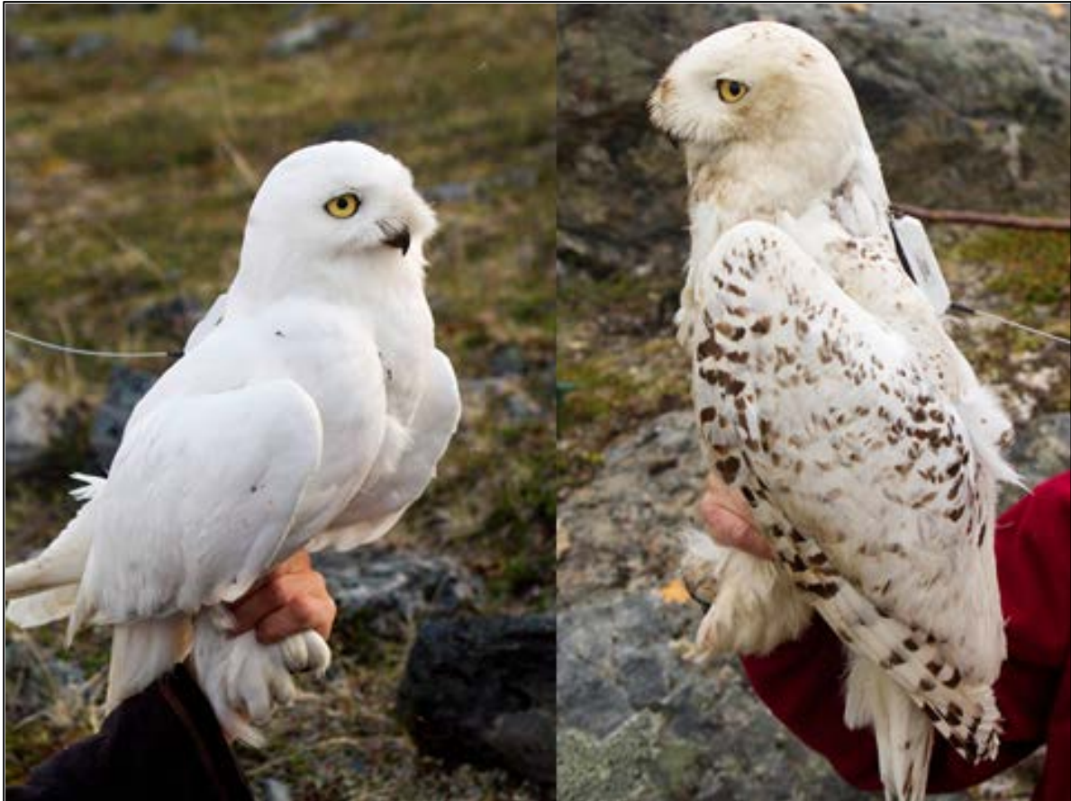
Figur 5. Snøuglehann (venstre) og hunn (høyre) utstyrt med satellittsendere.