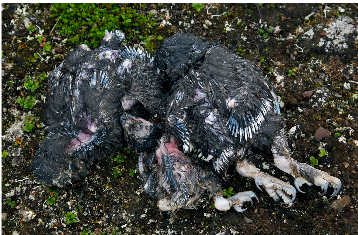
Figur 2. Tre snøugleunger, som døde etter et døgn med kraftig regnvær kombinert med lav temperatur.

Selv om det har vært uregelmessige og relativt få hekkinger av snøugler i Fennoskandia siden 1980-tallet, viser erfaringene fra 2011 at et år med mye smågnagere kan gjøre at snøuglene på nytt dukker opp i aktuelle hekkeområder. Data fra de satellittmerkede snøuglene fra 2007, viser at fuglene vandrer fram og tilbake gjennom året mellom Fennoskandia og områder i Russland så langt øst som til Tajmyr (Solheim mfl. 2008, Jacobsen mfl. 2011). Med unntak av de to reirfunnene i Midt-Sverige var snøuglehekkingene konsentrert i den nordligste delen av Fennoskandia. Dette til tross for at det i Norge var gode forekomster av smågnagere helt sør- over til Hardangervidda. Vi har imidlertid mottatt meldinger om observasjoner av snøugler i egnet hekkehabitat både i Trøndelag og i de nordlige fjellområdene i Sør-Norge. Vi tror at den relativt begrensede hekkeutbredelsen i 2011 skyldes at antallet snøugler som vandrer fram og tilbake mellom Fennoskandia og områdene lenger øst i Russland ikke er så store. Det er derfor god grunn til en viss bekymring for størrelsen på bestanden, spesielt sett i lys av de store endringene i fjell- og tundraøkosystemene som skjer som en effekt av klimaendringer.