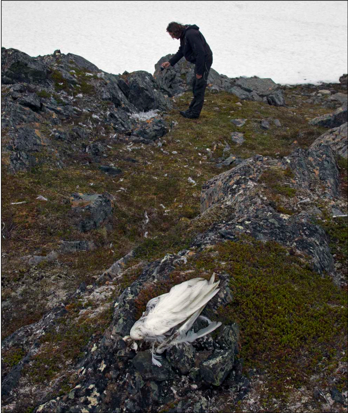
Figur 4. Snøuglehannen i et av parene ble funnet død nær reiret sitt, og den var åpenbart drept av en rovfugl. Tomas Aarvak inspiserer ribbområdet.

værelse (Solheim mfl. 2008). I 2011 ble det også observert hvordan snøuglehanner gikk til direkte angrep på havørn for å jage den ut av territoriet. Ved ett tilfelle fløy hannen opp i en høyde på flere hundre meter for å komme over ørna, slik at den kunne stupe ned på den.