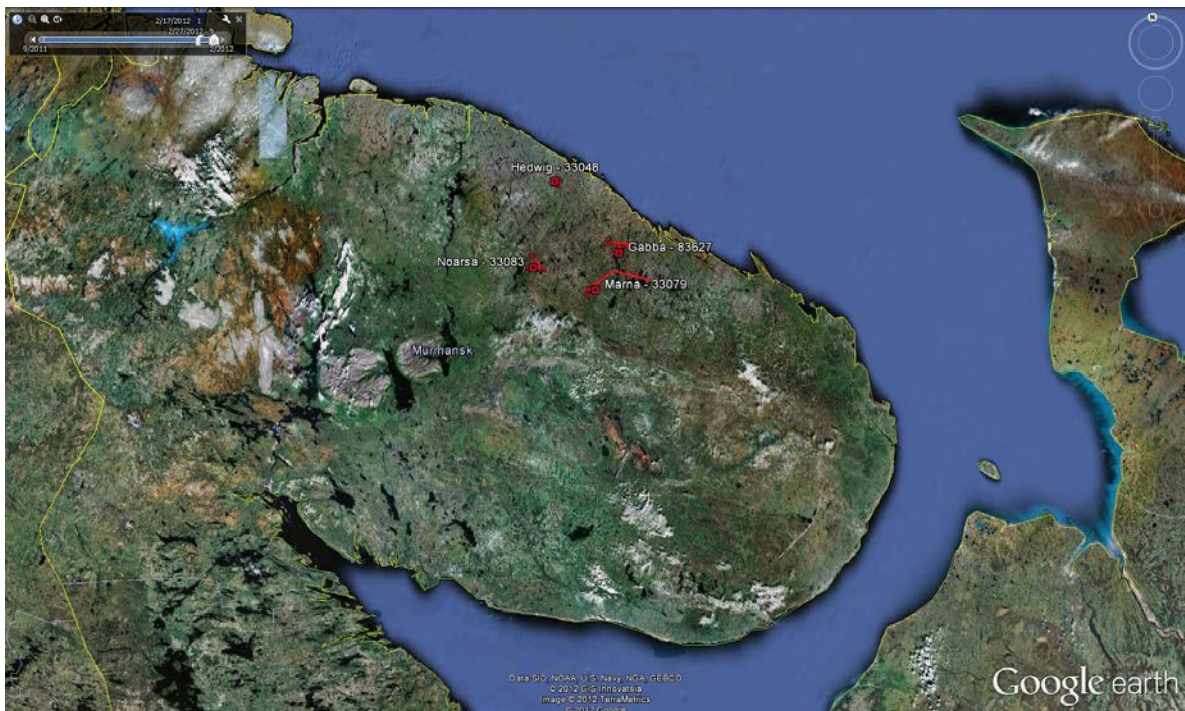
Figur 6. Vinterområdet for fire av de satellittmerkede snøuglehunnene gjennom vinteren 2011-2012.